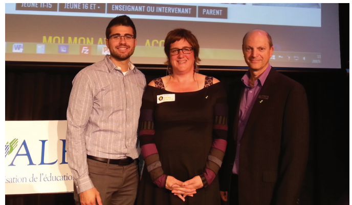
Lancement « Moi, mon avenir »

« Questions faciles à répondre, plateforme Web simple et rapide à utiliser, les résultats sont représentatifs et les métiers suggérés sont intéressants et réalistes. En somme, excellent site. Bravo à toutes les personnes impliquées! » Commentaires recueillis d'un papa et de son fils (6 e année) ayant utilisé le site