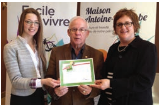
Changement de niveau de la certification OSER-JEUNES de la municipalité de Saint-Charles-Borromée

Le CREVALE a poursuivi son implication au sein du comité Conciliation études-travail (CET) du Réseau des Instances régionales de concertation en persévérance scolaire et en réussite éducative. Cet engagement lui permet de se documenter et de transférer l'information intégrée aux outils et textes produits et de soutenir les actions de la communauté d'affaires, des intervenants, des parents et des jeunes en persévérance scolaire. De plus, il a collaboré aux travaux du comité de suivi de la trousse autodiagnostic jeconcilie.com, un outil d'intervention visant à accompagner les jeunes dans leur réflexion sur la CET qui sera lancé cet automne.