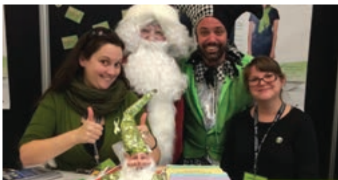
Salon de la persévérance scolaire « Agir ENSEMBLE Les Moulins »

La présence du CREVALE aux rencontres des comités PAS s'est maintenue tout au long de l'année afin d'y réaliser des activités de liaison, d'échange d'initiatives efficaces, d'accompagnement dans la relance des plans de priorités locales, et de soutien. Nous avons participé à la très grande majorité des rencontres. Les organisateurs communautaires ont été conviés à une rencontre d'information sur les données du décrochage scolaire avec les spécialistes du Centre de santé et de services sociaux de Lanaudière.