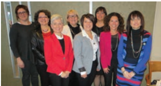
Colloque « Agir tôt Agir pour eux Agir ensemble »

La collaboration EFC est l'un des principes à la base des actions efficaces en persévérance scolaire et en réussite éducative. Les contributions d'une diversité de milieux doivent s'imbriquer et se compléter pour atteindre les objectifs visés par les actions. Ainsi, l'apport de tous les acteurs de la communauté est souhaitable pour soutenir la persévérance scolaire et la réussite éducative des jeunes.